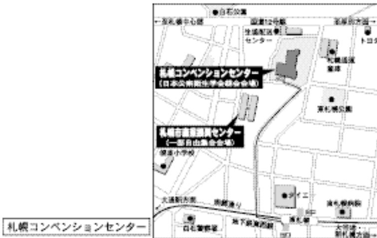
札幌コンベンションセンター